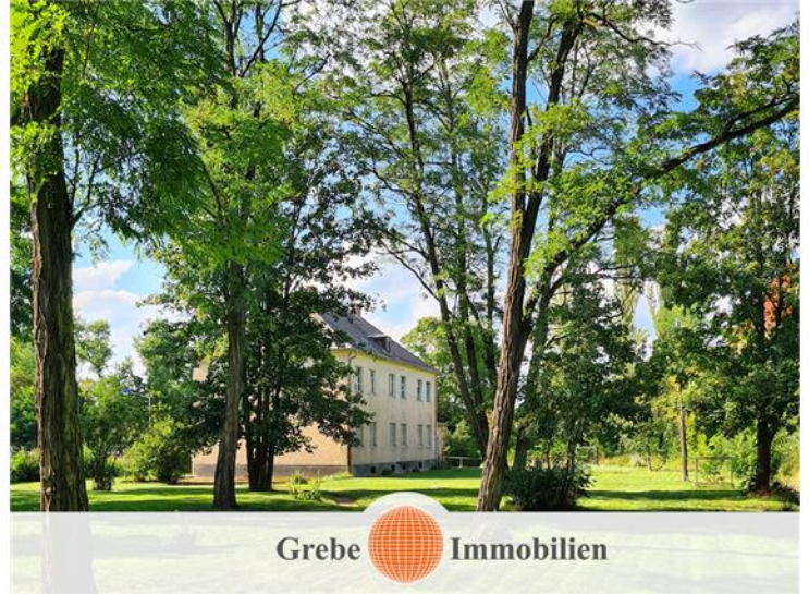
Park mit 3.000 m 2 für 5 Wohnungen