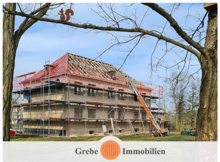
Fassadensanierung, Erneuerung der Dachziegel