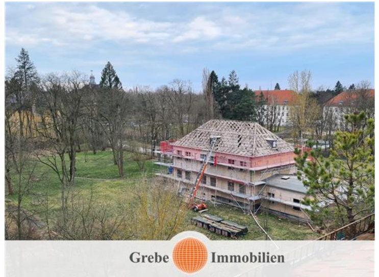
während der Sanierung 2024