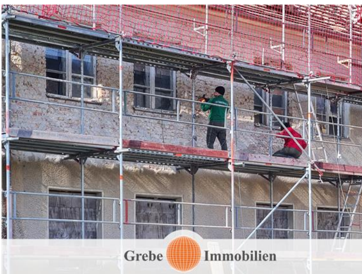
Entfernung des Putzes außen und innen