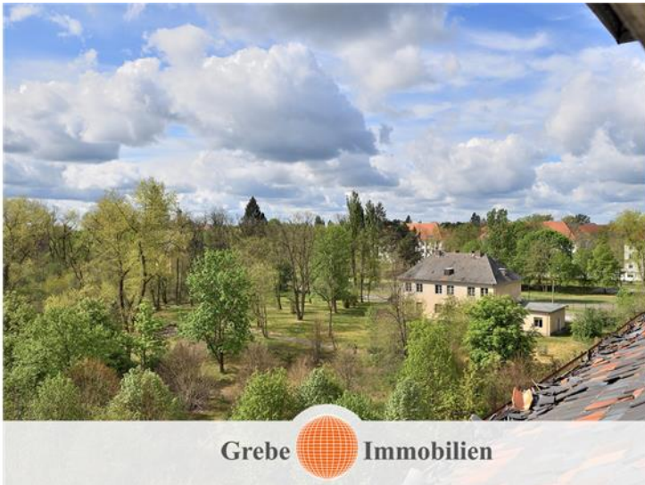
ruhige Lage in kleinem Park