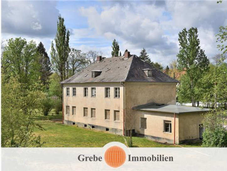
vor der Sanierung